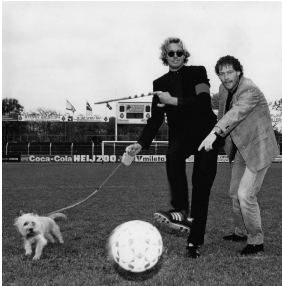
Met en als 'Danny Blind' voor It's my Life

Was hij als voetballer slechts een van de velen, als tv-maker ontsteeft Kraay jr. de grijze middenmoot. Dat viel ook John de Mol op. Volgens de mediamagnaat behoorde de voetballer samen met Marc Klein Essink en Linda de Mol tot de drie grootste tv-talenten van Nederland. Toen De Mol in 1996 Sport 7 uit de grond stampte, trok hij Kraay jr. aan als een van de gezichten van de nieuwe sportzender. Samen met Elsemieke Havenga presenteerde hij Sportcafé .