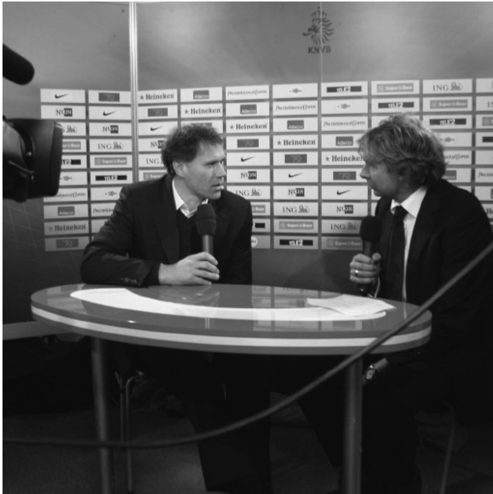
Na afloop van een interland met bondscoach Marco van Basten