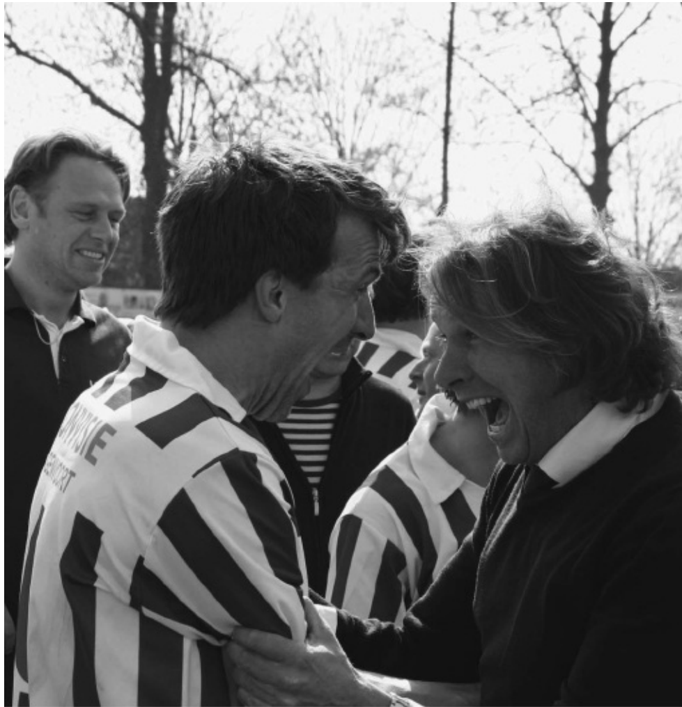
Als coach van FC Lienden na wéér een promotie