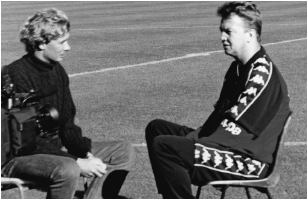
Op bezoek bij Louis van Gaal in Barcelona. 'Ik vind Louis van Gaal echt een afschuwelijke man.'