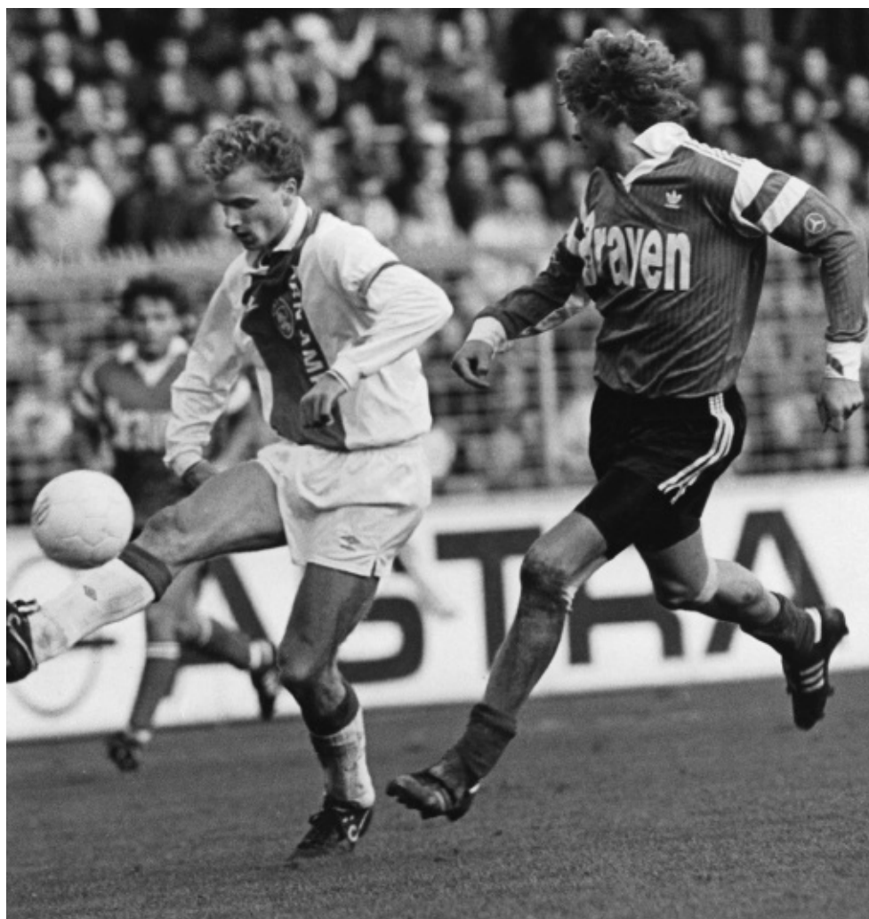
De frêle technicus versus de ordinaire schopper. 'Bergkamp was mijn grootste vernedering.'

In die zeventien jaar profvoetbal leek het soms wel alsof er twee personen in Hans Kraay jr. huisden. Meestal was hij beminnelijk en aanraakbaar voor iedereen. Gewoon, een leuke gozer. Maar er kon ook een duiveltje in hem bovendrijven en dan was er geen land meer met hem te bezeilen. Het maakte Kraay jr. ongrijpbaar en onvoorspelbaar. In 1983, als speler van NAC, sloeg hij een scheidsrechter neer. Hij was het niet eens geweest met een gele kaart. Gevolg: een schorsing van vierentwintig wedstrijden en een notering in de top-3 van langst geschorste voetballers.